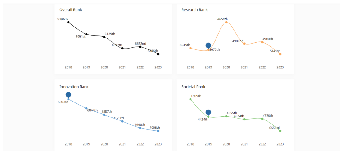
Rysunek 1. Pozycja SGH w rankingu SCI Mago